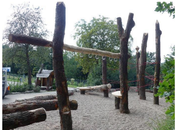
Abb. 5+4: Fotos aus dem Zwischenbericht der Wesersekundarschule in Vlotho (F201927318)