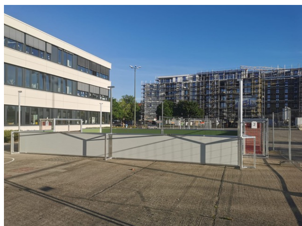
Abb. 7: Foto aus dem Zwischenbericht der GS im Blumenviertel (F201927819)