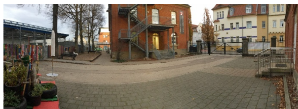
Abb.1 +2: Der Pausenhof der Montessori-Schule Ansbach vor dem Umbau (F201930072)