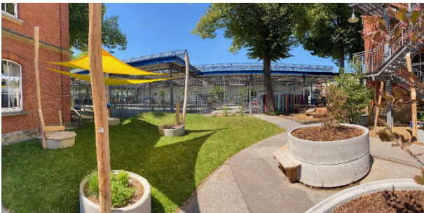
Abb. 3+4: Die Montessori-Schule Ansbach nach dem Umbau (F201930072)