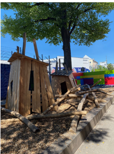
Abb. 6. Ein weiteres Foto des Schulhofs der Montessori-Schule Ansbach (F201930072)