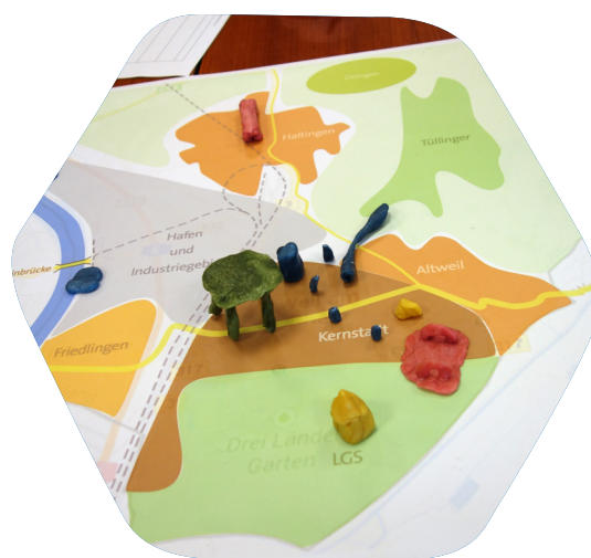
Ideen Weiler Jugendlicher zusammengetragen während des „stadtspieler-JUGEND“-Workshops

Als ein drittes Beteiligungsangebot wurde neben der Befragung und den Streifzügen für ältere Jugendliche ab 13 Jahren die Methode „stadtspielerJUGEND“ gewählt. Es entstand unter Mitarbeit Weiler Jugendlicher, in Anlehnung an die Methode „Stadtspieler“, eine auf Weil am Rhein abgestimmte Jugend-Version des Spiels. Bei der durch die Weiler Jugendlichen mitentwickelten Variante spiegelt sich der Weiler Stadtplan im Spielfeld wider.