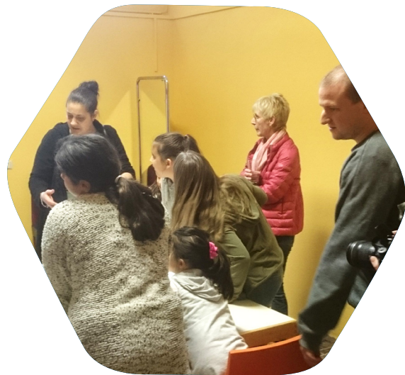
Beteiligung im Rahmen der Entwicklung des Stadtteils Friedlingen

des Parks flossen daher erste Ergebnisse aus einem Bürgerbeteiligungsverfahren mit ein. Zudem wurden in der Wettbewerbsausschreibung Ideen der Kinder und Jugendlichen berücksichtigt. Frühzeitig wurde auch das Jugendparlament eingebunden.